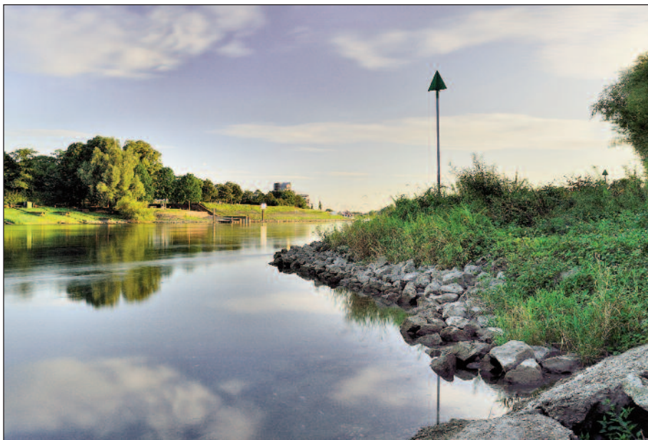
De IJssel bij Doesburg, voorjaar 2017

Donderdag 2 november a.s. bijzondere lezing in Het Meulenhuis, Bergstraat 48 te Doesburg, aanvang 20.00 uur (zaal open 19.30 uur).